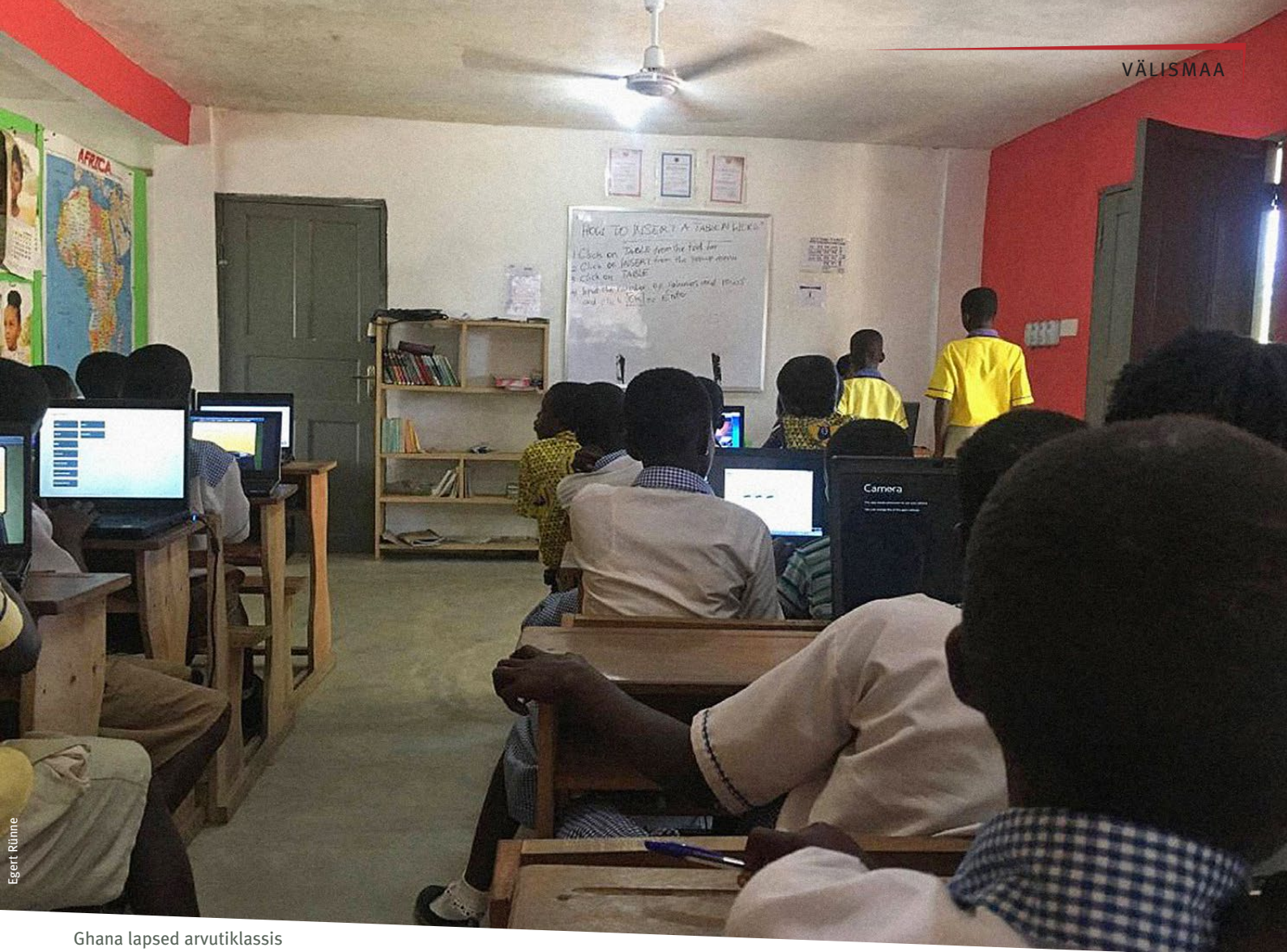
Ghana lapsed arvutiklassis

kohta. Naiste puhul on see üks võit viie kaotuse kohta. Olete kuulnud lugusid Vietnami külatüdrukutest, kelle röövimiseks ja Hiinasse pruudiks saatmiseks kasutatakse ära sotsiaalmeediat? Lihtne näide sellest, kuidas inimeste teadlikkus internetis peituvatest ohtudest ei ole piisav.