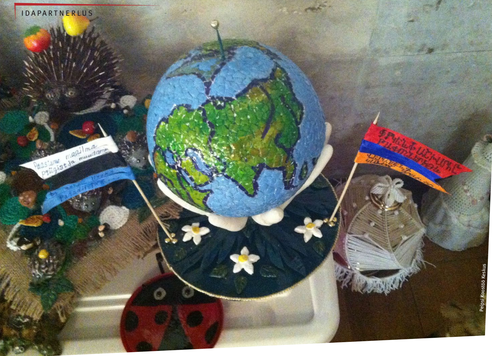
Peipsi Koostöö Keskus