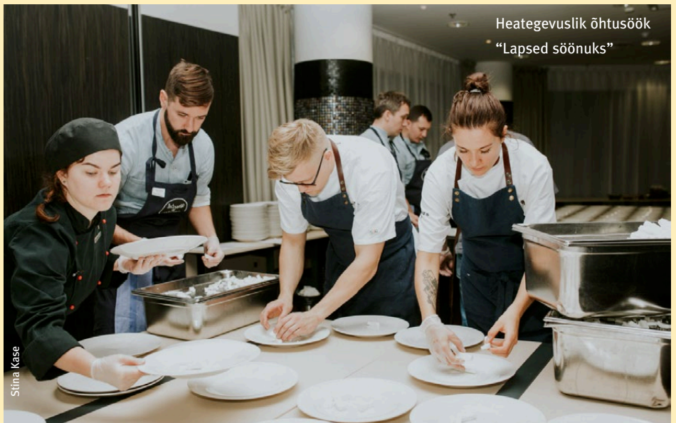
Heategevuslik õhtusöök "Lapsed söönuks"

Eesti tipprestoranide eestvedamisel toimus heategevuslik õhtusöök "Lapsed söönuks", mille kogu piletitulu ja oksjonitasud suunatakse Eesti Toidupanga struktuuri toetuseks. Heade inimeste abiga ületati sihiks seatud eesmärk 15 000 euro võrra ehk ühtekokku koguti 40 000 eurot, nii saab Toidupank jõuda kolmandiku võrra rohkemate abivajajateni.